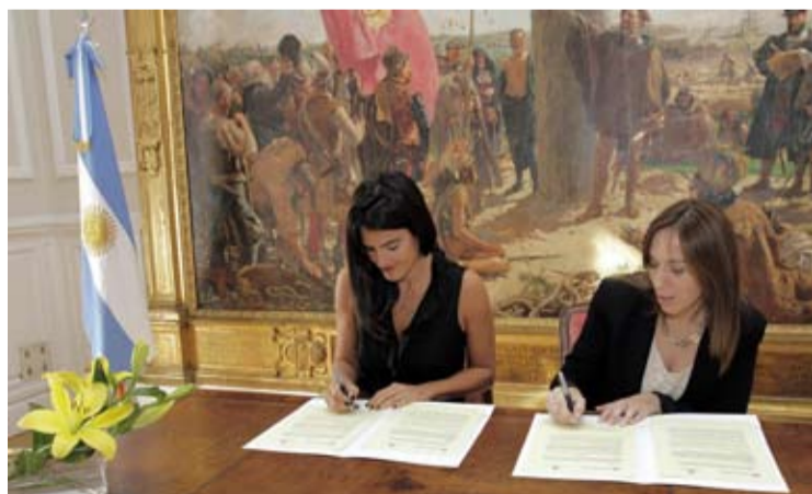
MARIA EUGENIA VIDAL, VICEJEFA DE GOBIERNO, FIRMO EL CONVENIO.