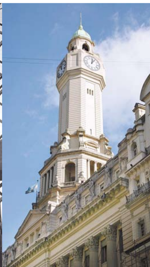
LA VISTA DE 1929, EN PERU Y DIAGONAL SUR. Y SU ACTUALIDAD: EL PALACIO LEGISLATIVO, REINCORPORADO COMO MONUMENTO HISTORICO.

tendente porteño- asistió a la colocación de la piedra fundamental el 18 de noviembre de 1926. La inauguración se produjo el 3 de octubre de 1931 al mediodía. Pero el cuerpo deliberativo de la Ciudad no estaba en funciones, dado el golpe militar de Uriburu