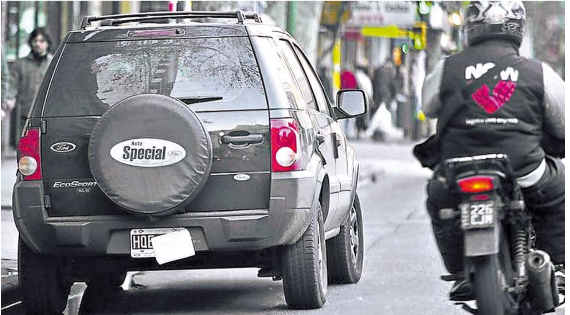
PARA EVITAR LAS FOTOMULTAS, ALGUNOS UTILIZAN TRAJOS, FRANELAS, AUTOADHESIVOS Y HASTA CDS, TAPANDO SUS PATENTES. SE ENDURECEN LAS SANCIONES.