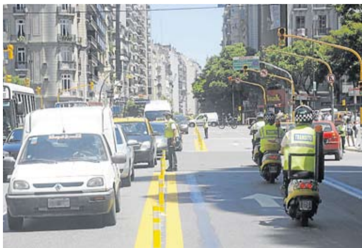
SANTA FE, DOBLE MANO DESDE JORGE LUIS BORGES HASTA ESMERALDA.

— Av. Jujuy. Se asignó doble sentido asimétrico al eje conformado por la avenida Jujuy entre las