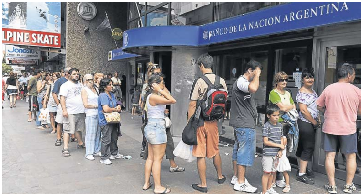
EN LA ATENCION DEL PUBLICO SE CONSIDERA "ABUSIVO" QUE HAYA QUE ESPERAR MAS DE MEDIA HORA EN FILAS PARA SER ATENDIDO.

tratación de cualquiera de estos servicios haya sido realizada en forma telefónica, electrónica o similar, podrá ser rescindida a elección del consumidor o usuario mediante el mismo medio utilizado en la contratación. (Iniciativa del diputado Daniel Lipovetzky).