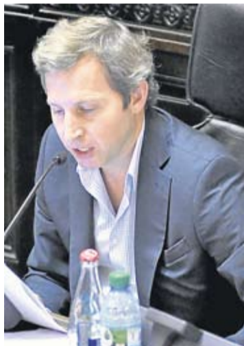
EL DIPUTADO ROGELIO FRIGERIO.

son destinados a gasto corriente y 6.577,1 millones al gasto de capital.