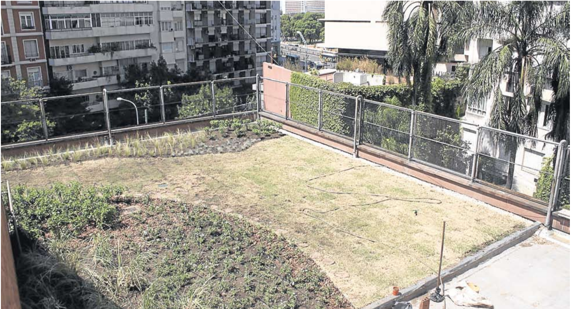
LA CUBIERTA DE UN TECHO, AZOTEA O TERRAZA VERDE DEBERA CONTAR CON UNA MEMBRANA AISLANTE HIDROFUGA, CARPETA DE PROTECCION Y RECUBRIMIENTO PREVIA A LA CAPA DE DRENAJE.

Por una reciente ley, los propietarios de edificios que implementen y mantengan estos nuevos espacios verdes en techos o terrazas podrán gozar de una reducción en el importe de ABL. El objetivo es contribuir con el medio ambiente urbano y el desarrollo sustentable.