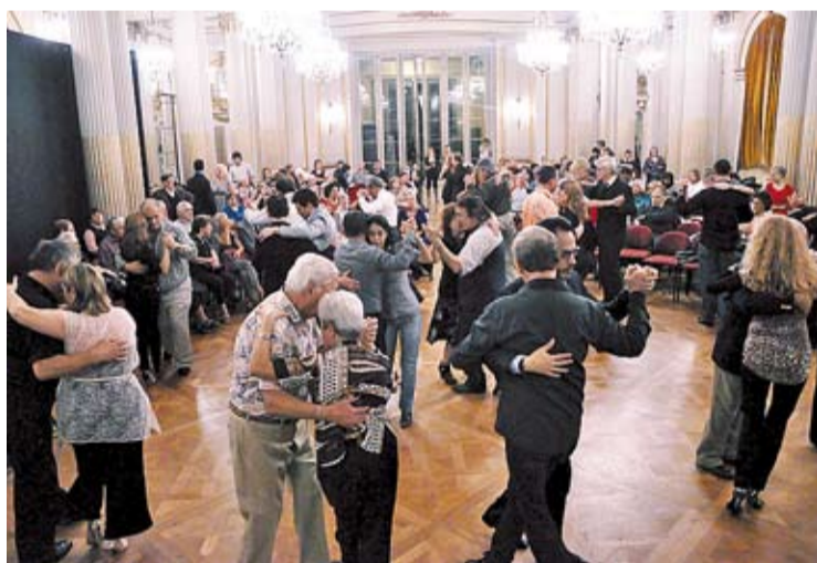
LA MILONGA ES PARTE DE LEGISTANGO: LOS MARTES, CADA QUINCE DIAS.

Desde la Banda Sinfónica de la Ciudad hasta la Orquesta de Cámara de Lanús, pasando por la Orquesta Sinfónica Juvenil de la Municipalidad de San Martín, que participa desde el primer concierto, todos los viernes el programa ofrece música académica, con la particularidad de que se interpreta, al menos, una obra de un compositor argentino. Así, nombres como Ginastera, López Buchardo o Guastavi-