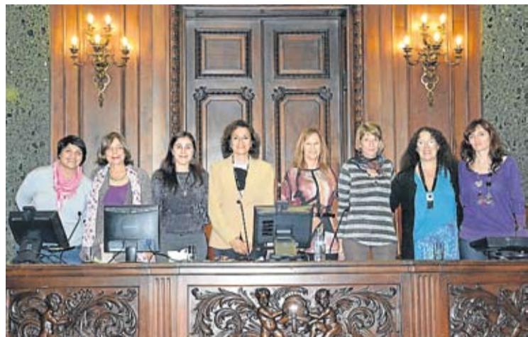
LA SESION INAUGURAL DEL SEGUNDO PARLAMENTO DE LAS MUJERES.

Más de 50 ONGs eligieron las nuevas autoridades del período 2013. Presentaron proyectos y propuestas.