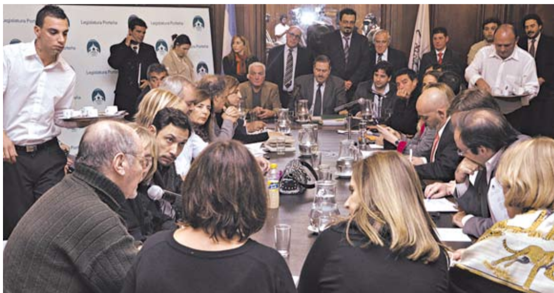
LA LEGISLATURA APROBO LA DEFENSA DE LOS MEDIOS PERIODISTICOS Y SUS TRABAJADORES.

Acerca del alcance que tendrá la normativa, uno de los artículos expresa que "corresponde a la Ciudad la jurisdicción de todas las materias relativas a los