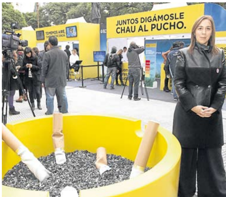
LA VICEJEFA DE GOBIERNO PORTEÑO, EN LA CAMPAÑA JUNTO A LALCEC.

La vicejefa de gobierno porteño y Presidente de la Legislatura, María Eugenia Vidal, participó el viernes pasado de la campaña organizada junto con LALCEC (Liga Argentina de Lucha contra el cáncer) para concientizar sobre los daños que causa el cigarrillo y las enfermedades que genera en fumadores activos y pasivos. La campaña consistió en invitar a la gente a realizarse un sencillo test para saber, en tres minutos, la cantidad de monóxido de carbono en el cuerpo. Con todas las mediciones realizadas, se logró alcanzar el "Guinness World Record" de mediciones de monóxido de carbono en aire espirado. La campaña, en el centro de la Ciudad, busca ayudar a los fumadores "a poder tomar una decisión que les hará ganar años en la vida", explicó Vidal. ■