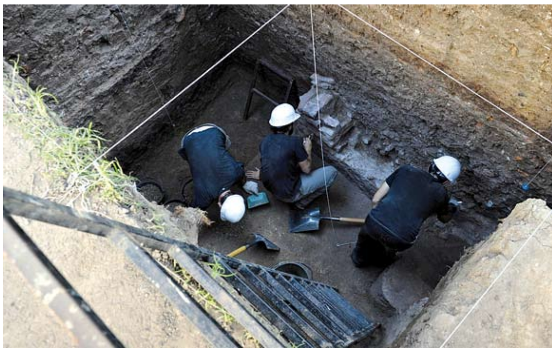
AUTORIZAN LA UTILIZACION DE ESTE SISTEMA DE TRACCION PARA EL SOPORTE DE MUROS.

La ley deja establecida la responsabilidad en esta materia del Constructor o del Representante Técnico de la Empresa de Excavación. Asimismo se determinó la obligación de presentar la correspondiente Póliza de Responsabilidad Civil, el estudio de suelos, relevamiento de fincas linderas, proyecto de excavación