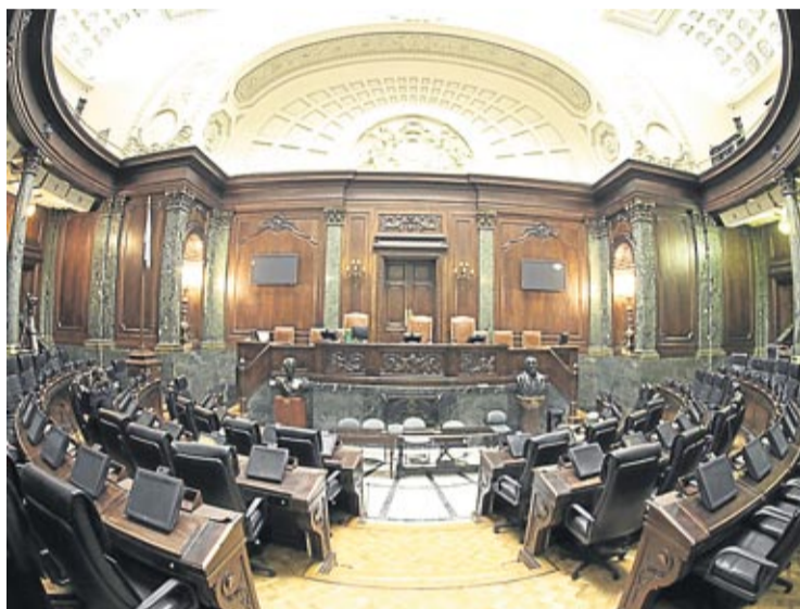
LA COMPOSICION DE LA LEGISLATURA CAMBIARA DESPUES DEL DOMINGO 27.

Por las 30 bancas legislativas en disputa competirán un total de 6 alianzas electorales y 18 partidos políticos. En total, 24 listas de candidatos.