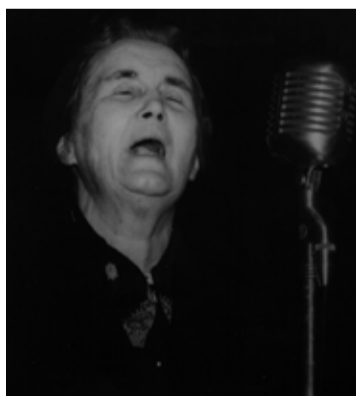
ALICIA MOREAU DE JUSTO.

La legisladora recordó que Alicia Moreau “luchó por los derechos de las mujeres cuando era impensado que alguien lo hiciera. Por su conciencia social siempre fue más allá de lo establecido y defendió los derechos humanos”. Participaron, entre