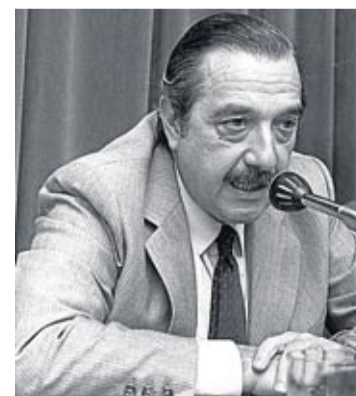
EL EX PRESIDENTE RAUL ALFONSIN.