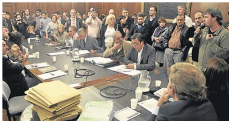
POROMUEVE EL DESARROLLO SOCIAL, ECONOMICO Y URBANISTICO.

Las comisiones parlamentarias de Presupuesto y Planeamiento Urbano, en la Legislatura, firmaron dictámenes a favor y en contra del proyecto del Plan Maestro para la Comuna 8. Organizaciones vecinales habían presentado objeciones a dicho Plan, pidiendo también la habi-