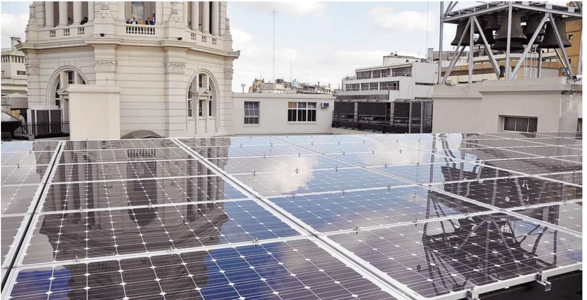
LA SEDE DEL PALACIO LEGISLATIVO SE CONVIRTIÓ EN EL EDIFICIO MÁS IMPORTANTE DE LA CIUDAD QUE CUENTA CON ESTE TIPO DE GENERACIÓN LIMPIA Y SUSTENTABLE.

En las terrazas del Palacio Legislativo porteño comenzó a funcionar el sistema de generación eléctrica sustentable más importante de los que se hayan instalado en un edificio de la Ciudad.