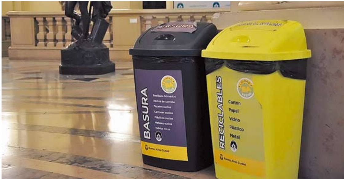
ESTOS RECIPIENTES PARA SEPARAR LA BASURA YA SE ENCUENTRAN EN LOS EDIFICIOS PUBLICOS DE LA CIUDAD.