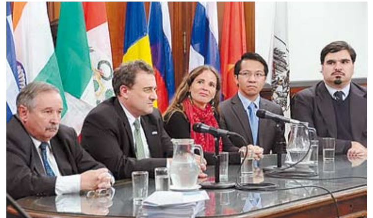
EL 21 DE MAYO FUE EL "DÍA MUNDIAL DE LA DIVERSIDAD CULTURAL".