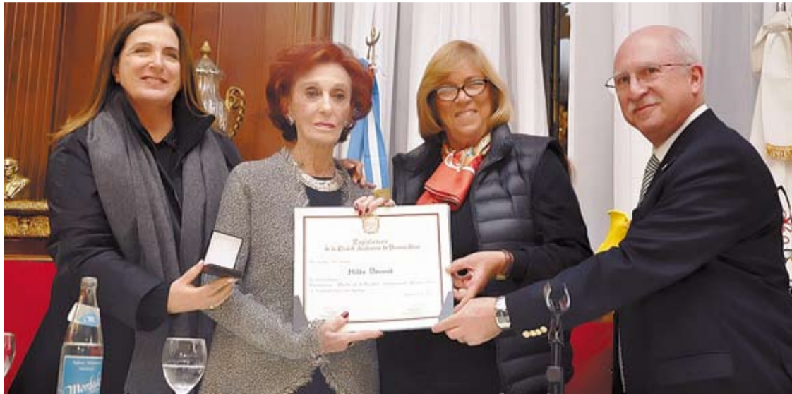
SE DESTACÓ LA EXCELENCIA Y EL COMPROMISO DE HILDA BERNARD CON EL GENERO ACTORAL.

El acto de reconocimiento se realizó en el Salón Eva Perón del Palacio Legislativo. Una trayectoria y un ejemplo.