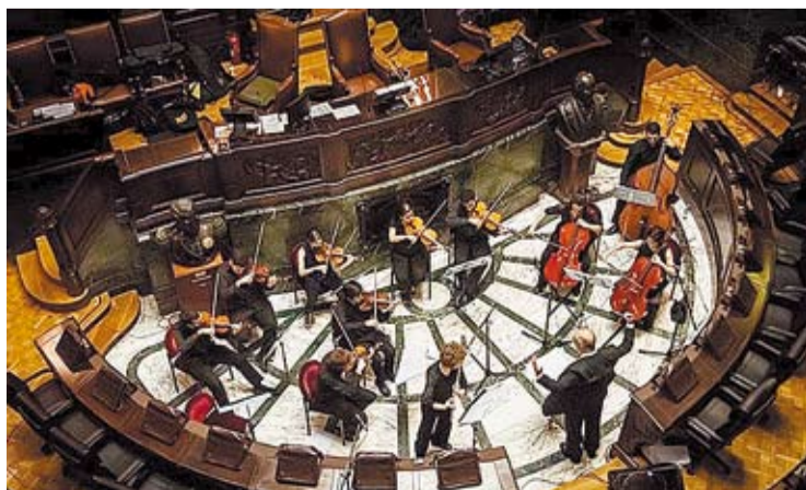
SE REALIZO UN CONCIERTO DE HOMENAJE A ATAHUALPA YUPANQUI.