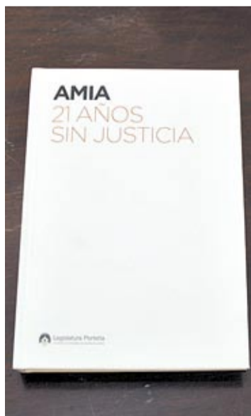
En homenaje a las víctimas.

El libro comienza con 21 páginas en blanco, que representan los 21 años que ya pasaron sin justicia. Luego hay 13 ensayos de miembros de la comunidad judía, personalidades de la cultura, la filosofía, el derecho, las creencias religiosas, la comunicación, el periodismo, la ciencia política y los derechos humanos. Entre los ensayos se destaca el del Papa Francisco, escrito en el momento en que era el cardenal Jorge Bergoglio, quien consideró en su nota que el atentado a la AMIA era una “bofetada a la humanidad de cada uno de nosotros”.