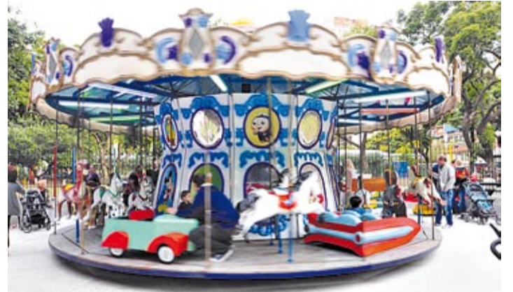
Las calesitas, una tradición para mantenerse en las plazas porteñas.

Aprobado. Los tradicionales carruseles en espacios públicos ya cuentan con su marco regulatorio.