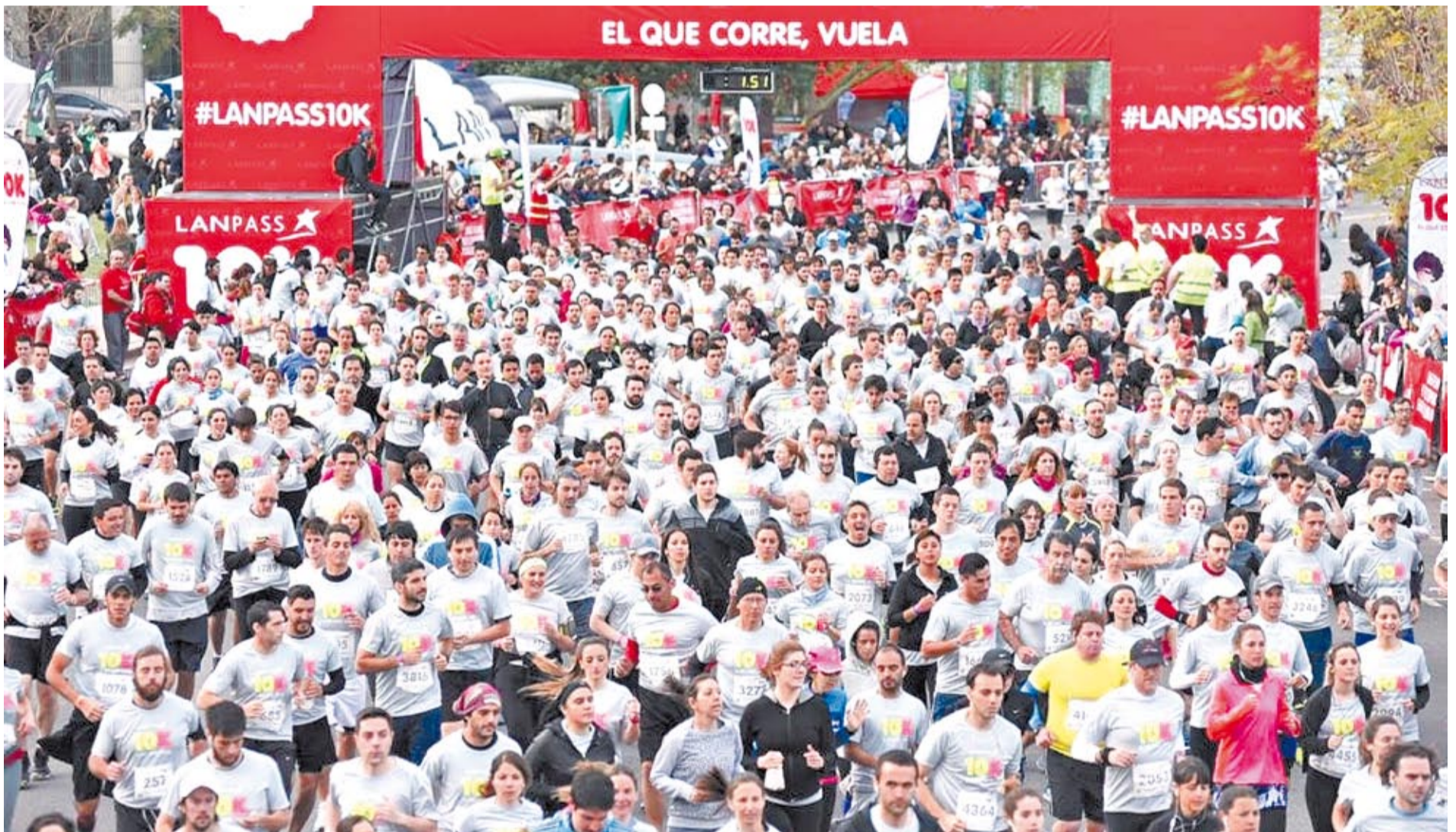
La práctica y las competencias del running cuentan cada vez con más adeptos en la Ciudad de Buenos Aires, una verdadera "capital latinoamericana" para los corredores.

Obligación. Tendrá validez por un año y se deberá presentar en cada carrera. En la Ciudad hay más de cien carreras por año y, en la más grande, participan unas 23 mil personas. Una actividad en auge.