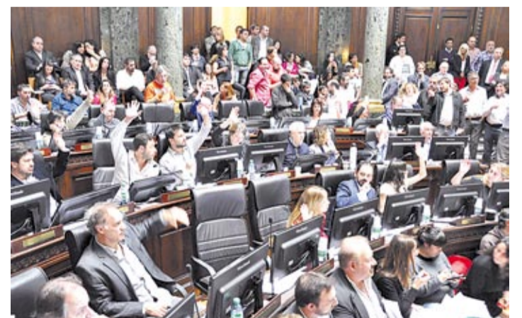
Un mensaje para sentirnos más cercanos a las islas.

Una ley dispuso colocar "señalética" de carácter informativo referida a las Islas Malvinas, Georgias del Sur y Sandwich del Sur en 16 puntos de la Ciudad de Buenos Aires. Consistirá en una flecha que indicará, en cada caso, la dirección y la distancia a la que se encuentra desde el lugar de su emplazamiento, con