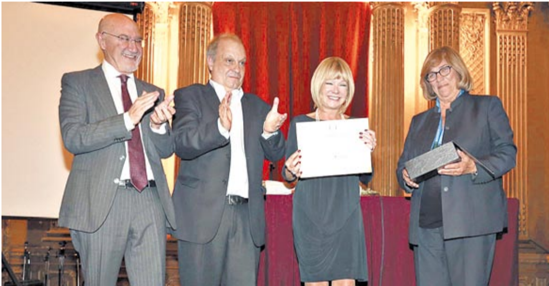
Un merecido reconocimiento para Soledad Silveyra, una de las artistas más populares de nuestro país.

Cultura. Fue distinguida como Personalidad Destacada, durante una ceremonia en el Salón Dorado de la Casa de la Cultura porteña. La acompañaron familiares y amigos.